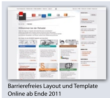
Barrierefreies Layout und Template Online ab Ende 2011